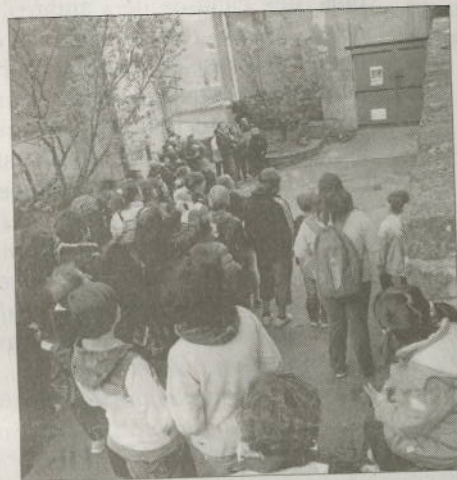
■ Moment d'émotion autour du panneau réalisé par Dominique Foa et les écoliers.