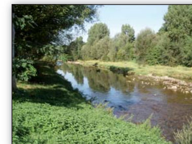
Un cours d'eau à la recherche de son équilibre

Enfin la société de pêche de St Affrique se propose de créer à Montlaur un parcours réservé aux enfants et adolescents afin de transmettre, à chaque génération, le lien avec la rivière.