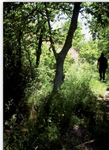
Un potentiel de chemins de randonnée

Afin d'assurer, dans un pays d'élevage, un partage harmonieux de l'utilisation de ces chemins, une charte de bonne conduite sera rédigée dans le cadre d'une concertation entre les différents utilisateurs : agriculteurs, associations de randonneurs. Enfin, il est proposé de former des guides locaux , qui assureront des accompagnements pédagogiques sur ces chemins de randonnées.