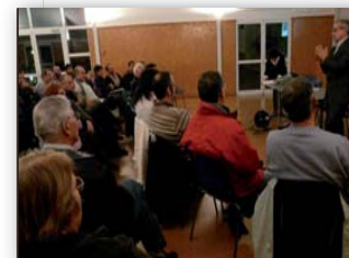
Groupe de travail du 06/11/09

Et comme dit l'adage : « la Terre ne nous appartient pas, nous l'empruntons à nos enfants » !!!