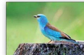
Le Rollier d'Europe