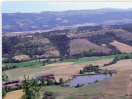
Le paysage, espace du vivant

Enfin, il est prévu l'organisation d' une journée festive grand public pour montrer comment Montlaur et les rougiers ont été à l'origine du développement de la production de lait de brebis sur le bassin de Roquefort.