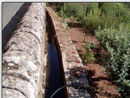
Le canal et ses jardins, la richesse de Montlaur

L'entretien du canal , assuré par l'ASA et ses adhérents, sera renforcé par un appui des services techniques de la mairie. Enfin, le canal et ses jardins seront intégrés dans le réseau des chemins de randonnées représentants du patrimoine économique et culturel de Montlaur, ils seront expliqués aux habitants et randonneurs, grâce à des panneaux pédagogiques